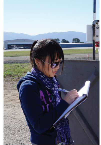
El DPR opera una red de estaciones de monitoreo del aire ambiental en regiones agrícolas.

La Rama de Monitoreo Ambiental monitorea el medio ambiente para determinar el destino de los pesticidas y analiza los peligros potenciales en el aire, tierra, aguas del subsuelo y aguas superficiales. Utiliza datos científicos para desarrollar