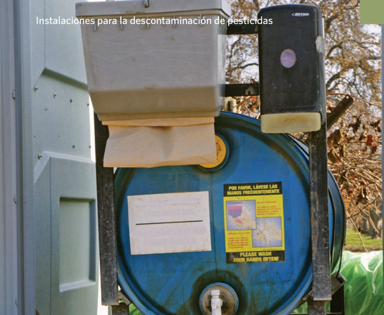
Instalaciones para la descontaminación de pesticidas