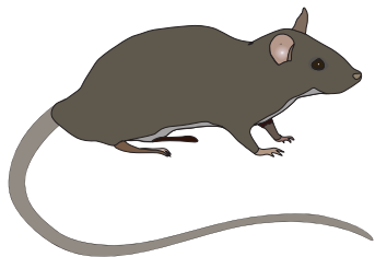
Rata de techo

Coloque las trampas cerca de las paredes, detrás de los objetos y en los rincones oscuros.